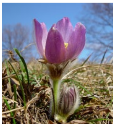
Deutliche Vermehrung der großen Kuhschelle

Im heurigen Frühjahr wurde der Erfolg der Umstellung deutlich sichtbar: Der hohe Anteil an Jungpflanzen der Großen Kuhschelle ( Pulsatilla grandis ) belegt den Erfolg der Umstellung.