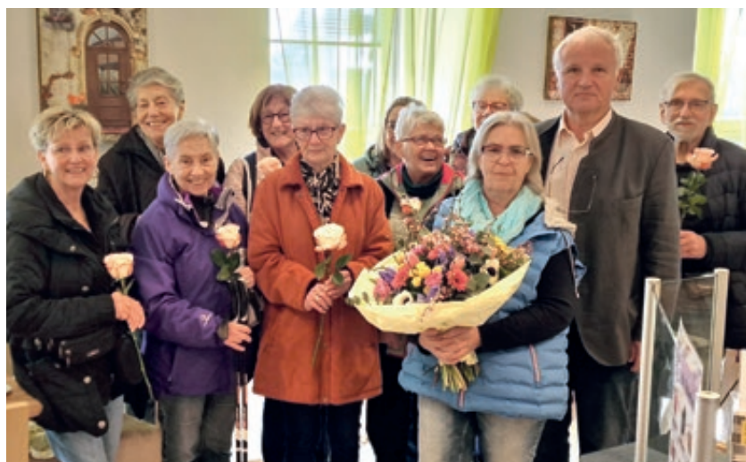
Mit einem lachenden und einem weinenden Auge bedanken wir uns herzlich bei den treuen Kundinnen und Kunden unserer kleinen Bäckerei.