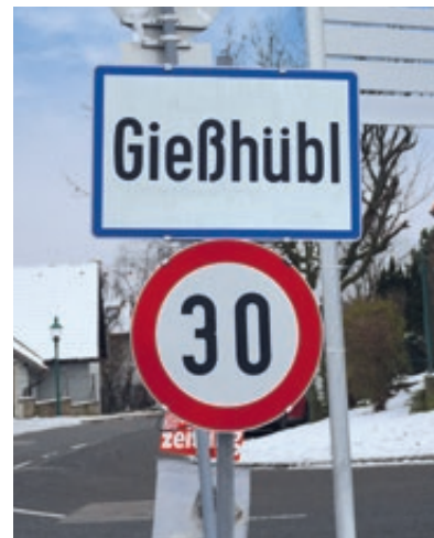
Der 30-er im Ortsgebiet hat sich bewährt.

Die oft gestellte Frage der Abschaffung des Rechtsvorrang in der Perlhofgasse ist mir der Empfehlung des 30er für das Ortsgebiet ebenfalls abgehakt. Verkehrsexperten raten davon ab, bei Tempo 30 weitere lenkende Maßnahmen zu verordnen.