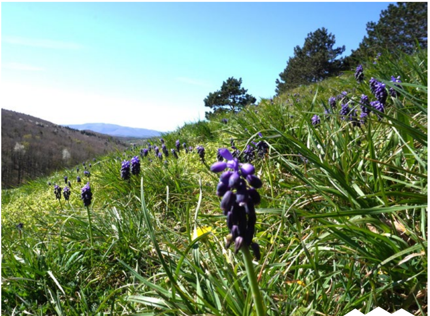
Auf der Gießhübler Heide blüht wieder die Traubenhyazinthe, liebevoll auch „Rauchfangkehrer“ genannt. Mehr zur Artenvielfalt auf unserer Kuhheide erfahren Sie im Blattinneren auf den Seiten 14 – 15.

Das Frühjahr bringt nicht nur mildere Temperaturen, sondern auch neue Energie und Zuversicht in unseren Alltag. Menschen zieht es wieder nach draußen, wo Begegnungen und gemeinsames Erleben an Bedeutung gewinnen. Es ist die Zeit des Aufbruchs, Wachsens und kleiner Neuanfänge. Auch in unserer Gemeinde wird diese besondere Jahreszeit spürbar.