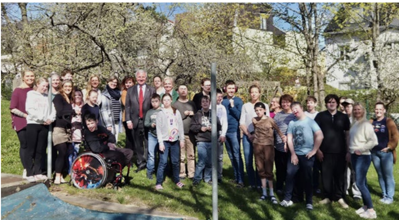
Schüler und Lehrer freuen sich, in Gießhübl ihre neuen Klassenzimmer gefunden zu haben

Dieses Projekt zeigt eindrucksvoll, wie durch rasche, konstruktive Zusammenarbeit zwischen Gemeinden und Land auch in herausfordernden Situationen tragfähige Lösungen gefunden werden können. Ganz im Sinne des Leitsatzes: Wer schnell hilft, hilft doppelt.